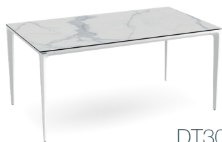
DT300MA 160 x 90 x h74 cm