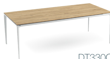
DT330CC 220 x 100 x h74 cm