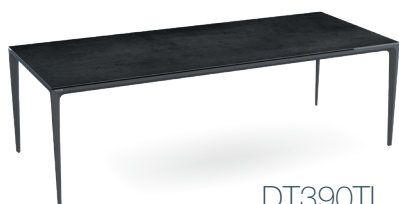
DT390TI 240 x 100 x h74 cm