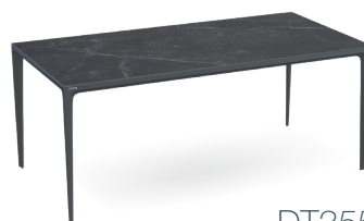
DT355MM 180 x 90 x h74 cm