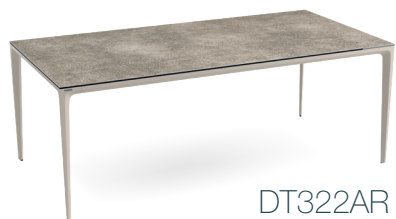
DT322AR 200 x 100 x h74 cm